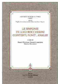
LE SINFONIE DI LUIGI BOCCHERINI a cura di Marco Mangani, Germán Labrador e Matteo Giuggioli Olschki 2019, pagg. XV-294, € 35,00

Questa raccolta di saggi affronta l'esperienza sinfonica di Luigi Boccherini. In vita e nell'unico momento in cui i suoi lavori conobbero un vero successo postumo (tra la scomparsa dell'autore e il 1840), il compositore lucchese (1743-1805) fu percepito essenzialmente come un musicista da camera. Le sue Sinfonie, ad esempio, non esercitarono un impatto significativo sul panorama musicale del tempo e, con tutta probabilità, la loro diffusione si limitò a confini locali, e circoscritta agli ambienti della loro committenza, esclusa qualche rara apertura pubblica. La fortuna delle opere d'arte, il loro oblio, la loro riscoperta e valorizzazione, dipende da innumerevoli fattori: uno di questi è la "sintonia" che si crea con certi periodi storici, al di là dell'intrinseco valore del prodotto artistico. Insomma, dai mutevoli criteri con cui vengono recepite e valutate. La fortuna delle Sinfonie di Boccherini ha iniziato a prendere quota a partire dall'ultimo ventennio del '900: non tanto nell'ambito concertistico, quanto in quello discografico, comunque circoscritto. I nove saggi che costituiscono il libro sono raggruppati in tre sezioni – Contesti, Fonti e Analisi – e offrono un quadro ampio e aggiornato dell'argomento. Breve ma significativa, per ciò che si è detto, è la nota discografica che offre una panoramica della fortuna delle Sinfonie di Boccherini in questo ambito fondamentale per la diffusione della musica.